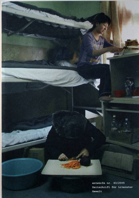
entwürfe nr. 43/2005 Zeitschrift für Literatur Gewalt